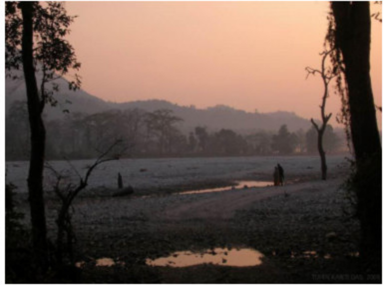
We and She