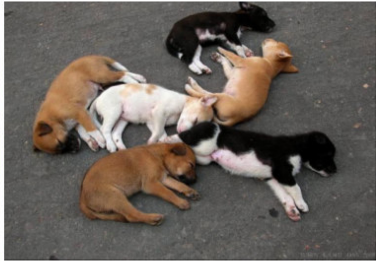
We are sleeping